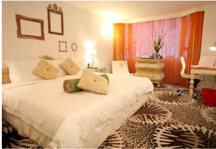
設計充滿型格的豪華客房