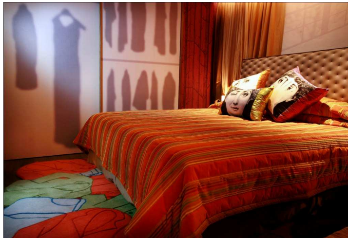
主題套房 – Mirage 帶領賓客進入超現實空間，各種陳設都充滿驚喜。