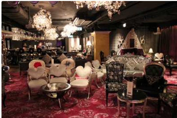
Dada Bar + Lounge 夢幻般的室內佈置贏盡《婚禮雜誌》的讚許。