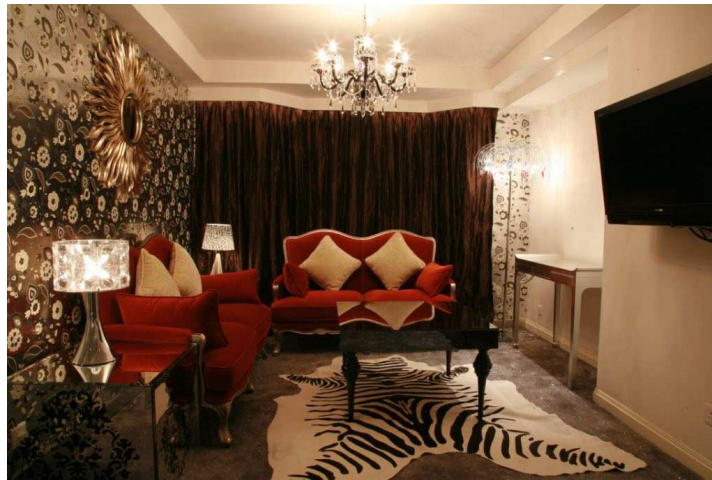
主題套房 – Royale 房間內令人炫目的傢具，盡顯 1940 年代荷里活的奢華氣派。